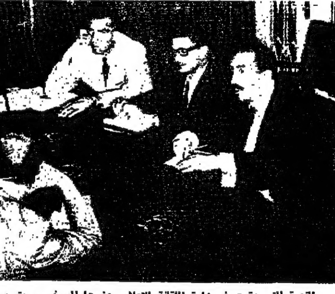
القادة التي عقدت في وزارة الثقافة والاعلام وحضرها البروفيسور بيتر سيث من جامعة كورنيل الامريكية وبحث فيها قضية تسرب الجامعيين من السعودية العالمية الى امريكا

في مؤتمرين دوليين عمان - غادر عمان صباح امس الى القاهرة الدكتور يوسف ذهني السكرتير العام للامم المتحدة لاجتماع مؤتمر الصليب الاحمر الدولي الذي سيعقد في هلستي في الفترة من ١٨-٢٤ من شهر نونو الحالي . ويصل الدكتور ذهني الازدين في مؤتمر طب الامم الدولي الذي سيعقد في وارنا بيقاريا في شهر ايلول القادم بصفته حديرا لاقسم طب الانسان